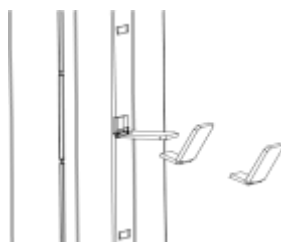
Rys. 2. Montaż zaczepu półki

Szafy dostarczane są z półkami zapakowanymi oddzielnie i ułożonymi na dnie. Po rozpakowaniu półek należy umieścić zaczepy półek (znajdujące się w woreczku) w odpowiednie otwory w listwach (rys.2). Na zaczepy półek położyć półki. Umiejscowienie półek zależy od potrzeb użytkownika i może być regulowana.