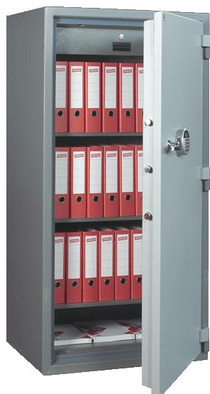
Office 3400 E