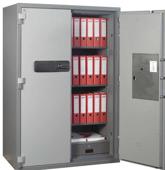
Office 3700 EK

Seria szaf Office 3000 zapewnia pełne bezpieczeństwo składowanej dokumentacji i jej ochronę przed niszczącym działaniem ognia w najwyższej klasie – 120P.